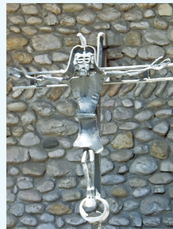
天主堂祭台前的十字架

六十年代開始，紀念館內開始建立不同的宗教建築。最先是一九六〇年的天主教小堂（Christ's Mortal