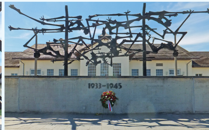
紀念集中營受害者的藝術品