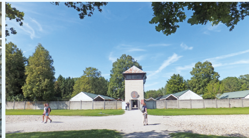
集中營紀念館的加爾默羅隱修院