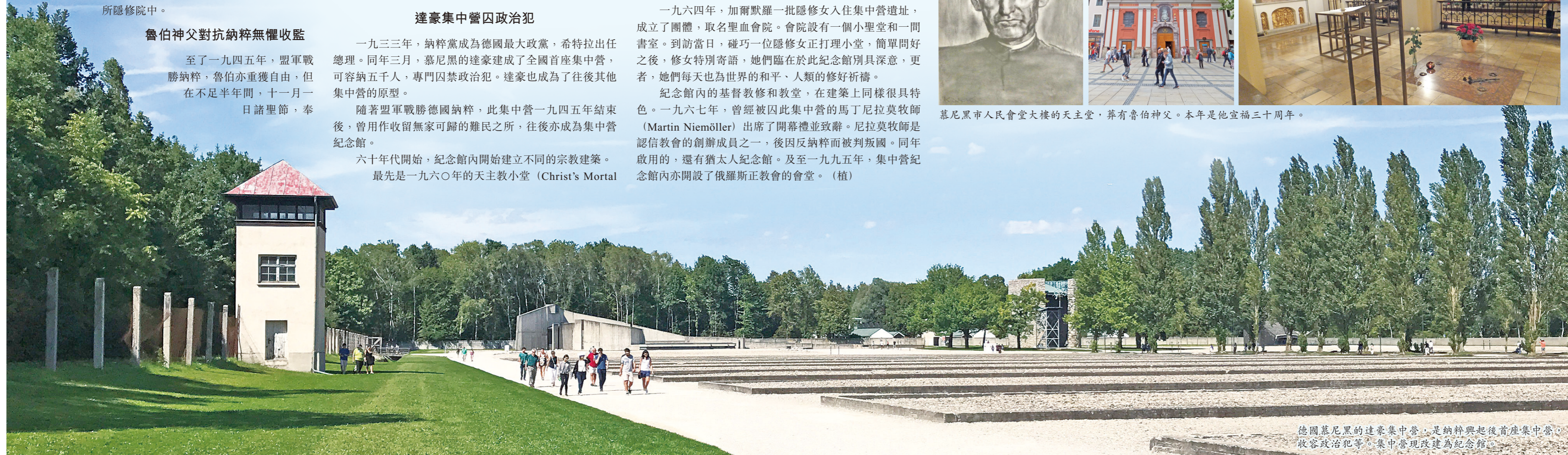
德國慕尼黑的達豪集中營，是納粹興起後首座集中營，收容政治犯等。集中營現改建為紀念館。