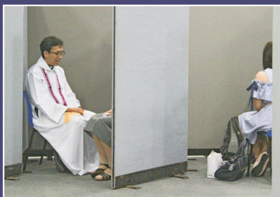
傳教節十月一日會期設修和聖事