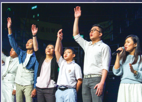
十月二日會期大合唱