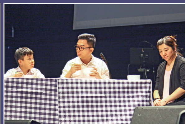
十月二日的福傳話劇