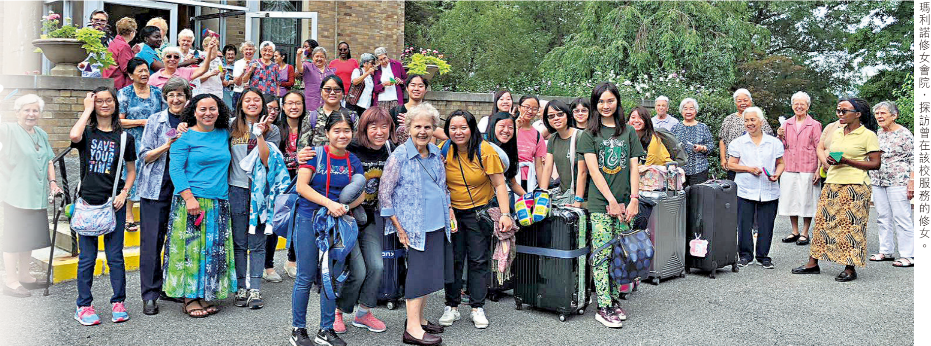
瑪利諾修會學校（中學部）師生到訪位於美國紐約的瑪利諾修女會院，探訪曾在該校服務的修女。