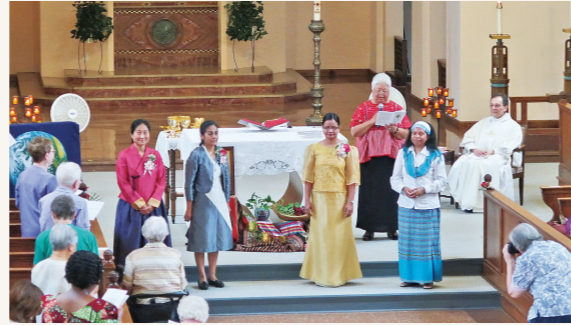
見證四位修女宣發永願