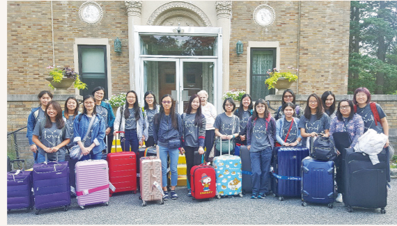
瑪利諾修會學校師生

瑪利諾修院學校（中學部）師生八月十至十九日到美國紐約奧辛寧瑪利諾修女會院，探訪曾在香港服務的年長修女，認識會院歷史，以下是該校學生與舊生的分享：