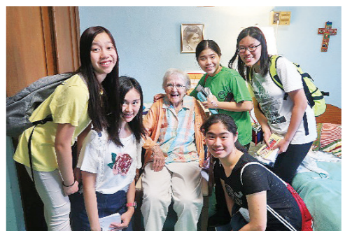
學生細聽修女分享昔日校園軼事