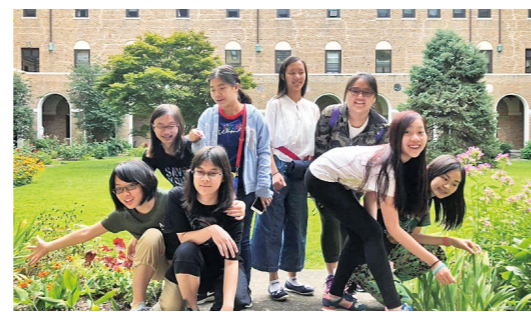
學生在會院外清除雜草

我在整個旅程中能夠體驗這麼多，在有限的時間裡參與各類活動，例如觀看日光初現、在早上與修女一起唱聖詩、協助派送報紙及在Pachamama農場幫忙收割有機農作物等。另外，除草帶給我新鮮感，讓我們身體力行幫助修院做一點事情。我們中有些同學還協助祭台工作，在彌撒後清理聖爵，以及為七月和八月生日的壽星布置活動室。我們的服務是彼此傳播愛和歡樂。