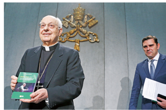
聖座公布《生活的基督》