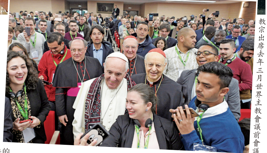
教宗出席去年三月世界主教會議前會議

（梵蒂岡新聞）聖座四月二日公布教宗方濟各簽署、以青年為題的世界主教會議後宗座勸諭，題為《生活的基督》，內容鼓勵青年致力辨別並回應召叫。