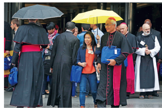
世界主教會舉行期間青年與主教同行