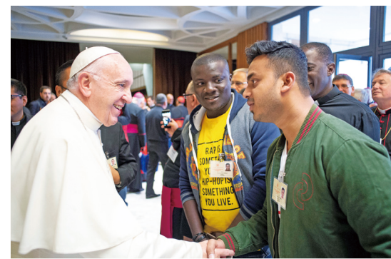
教宗在世界主教會上與青年打招呼